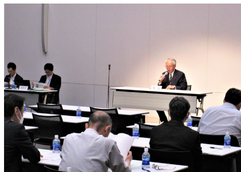
金森会長による議事進行のようす